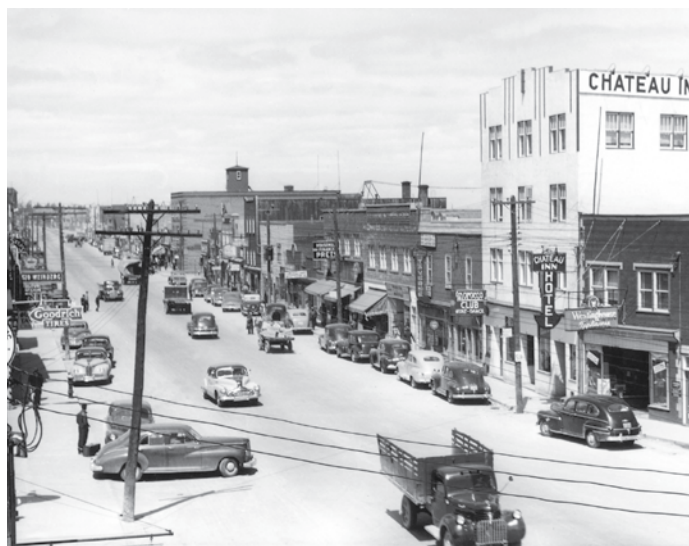
La 3 e Avenue, entre les 7 e et 8 e Rues, en 1950.