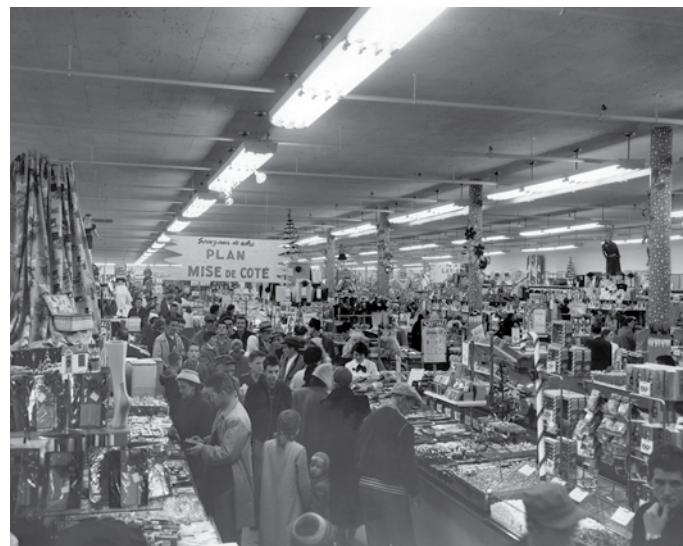
Le magasin S.S. Kresge, envahi par une foule de consommateurs, dès son ouverture, en 1952.