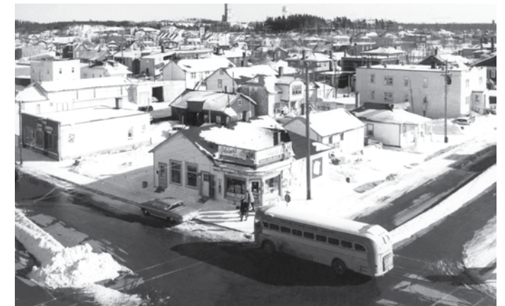
Au milieu des années 1950, Bourlamaque à vol d'oiseau, à partir du sommet de l'hôtel Sigma, au coin de l'avenue Centrale, de la 3 e Avenue et de la 16 e Rue. C'est sur cette pointe que s'installe le premier cirque de passage à Val-d'Or.